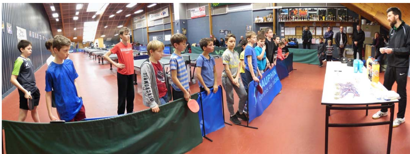
Les participants du tournoi attendant leurs récompenses