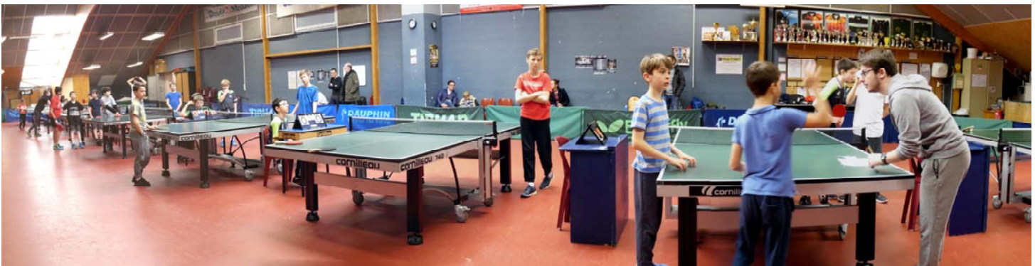
La montée/descente géante