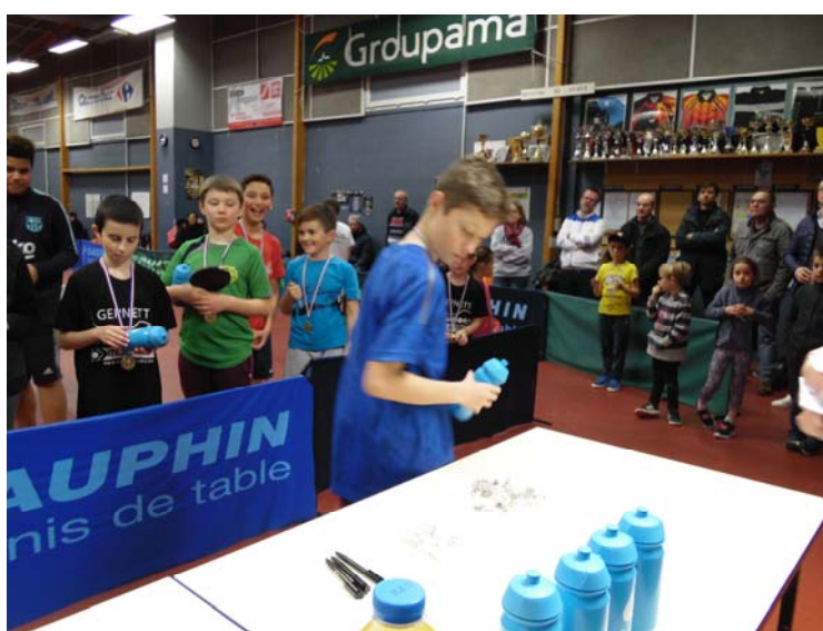
Après la remise des médailles, chacun choisit une autre récompense parmi les lots proposés