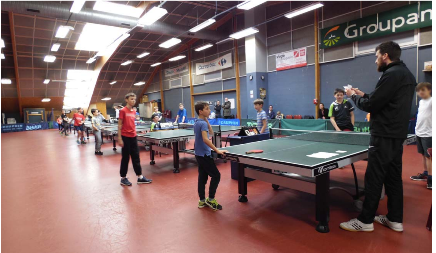
Explications de l'arbitrage