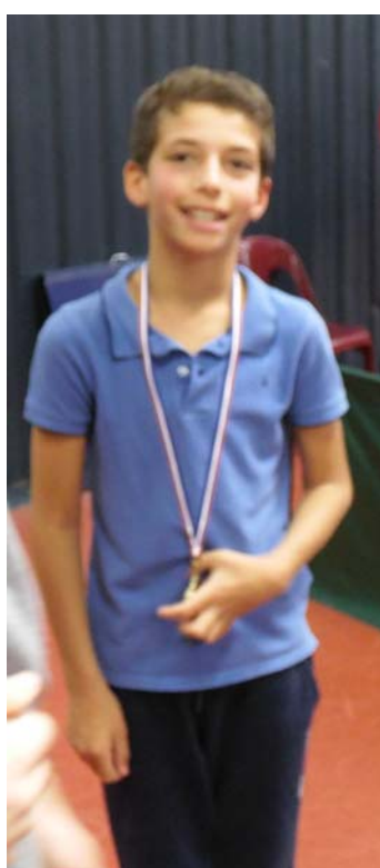
Karl 1 er des Benjamins-Poussins